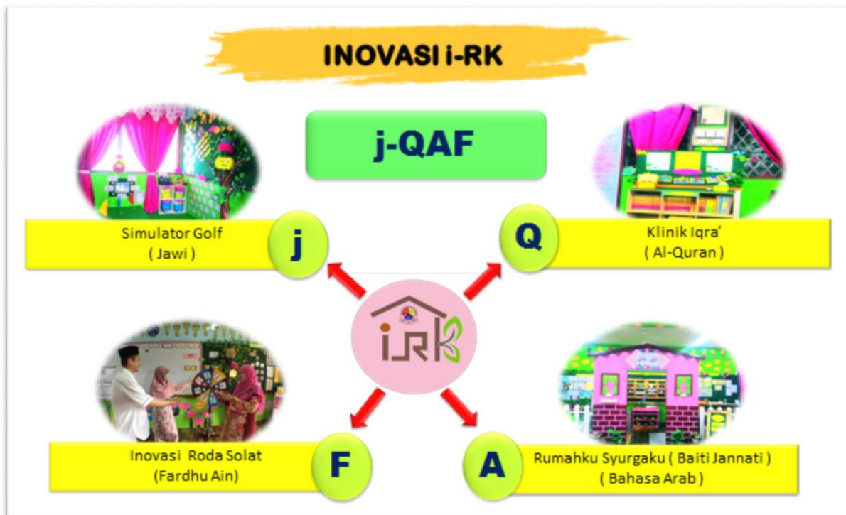
Rajah 1. Inovasi dalam i-RK

Guru Besar sebagai pemimpin strategik sekolah telah membuat analisis SWOC untuk melihat kekuatan dan peluang yang ada di SK Taman Anggerik. Kepimpinan teragih kepada kumpulan middle leaders dan ketua-ketua panatia bagi menjayakan projek i-RK ini.