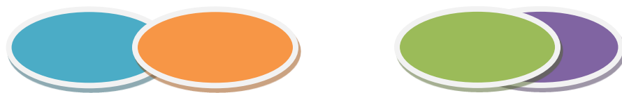
Rajah 2 : Teori overlapping influence

Dilihat dari perspektif yang lain pula, teori yang pertama berkaitan hubungan keluarga dan sekolah ialah separate influence (pengaruh secara berasingan) melihat tiada hubungan antara pihak sekolah dan keluarga. Sekolah dan keluarga dianggap sebagai dua entiti yang berasingan. Manakala Model Tanggungjawab secara Berurutan ( Sequenced-responsibilities ) mengandaikan keluarga berperanan untuk mengasuh anak dan pihak sekolah pula mendidik mereka. Akhirnya, Model Pengaruh secara Bertindan ( Overlapping influence ) mengetengahkan kolaborasi kerjasama, dan pakatan antara keluarga dan pihak sekolah pada tahap tertentu (UPM, n.d.)